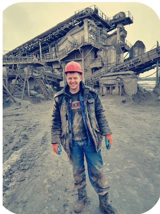
2021 год Трудовые будни на Сунском карьере